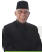
HJ ZAINAL ABIDIN YAHYA Presiden